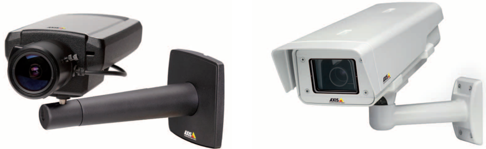
그림 1: Lightfinder 기술이 탑재된 카메라의 예(AXIS Q1602 및 AXIS Q1602-E)

주야간 카메라는 실외에 설치하거나 조명이 충분하지 않은 실내 환경에서 사용할 수 있도록 설계된 제품이다. 주야간 컬러 네트워크 카메라의 경우 낮 시간에는 컬러 이미지를 제공하지만 빛이 감소하면 카메라가 야간 모드로 자동 전환되어 근적외선(IR)을 활용, 흑백 이미지를 촬영할 수 있다. 특히 실외 조명 조건이 다양한 곳에서 이미지 선명도를 유지하고 노이즈 수준을 낮추는 것은 분명 어려운 일이다. 이에 따라 엑시스 커뮤니케이션즈는 연구개발을 통해 새롭고 혁신적인 Lightfinder 기술을 도입하게 되었다. Lightfinder 기술은 올바른 센서와 렌즈를 세심하게 선택해 얻은 결실로, 이 기술을 활용하면 센서와 렌즈를 결합시켜 정교한 이미지 데이터를 창출할 수 있다. 센서, 렌즈, 사내 칩 개발 및 이미지 처리 기술 등의 요소를 융합하여 Lightfinder 기술과 탁월한 성능이 내장된 네트워크 카메라를 선보이고 있다.