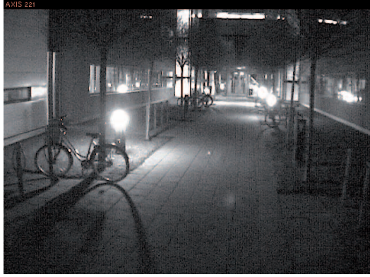
그림 3: 야간(오후 11시 50분)에 조명도가 4 ~ 6lux인 건물 입구 감시 상황

왼쪽: AXIS 221 왼쪽 아래: 품질이 뛰어난 저조도 아날로그 카메라 오른쪽 아래: Lightfinder 기술을 갖춘 AXIS Q1602-E