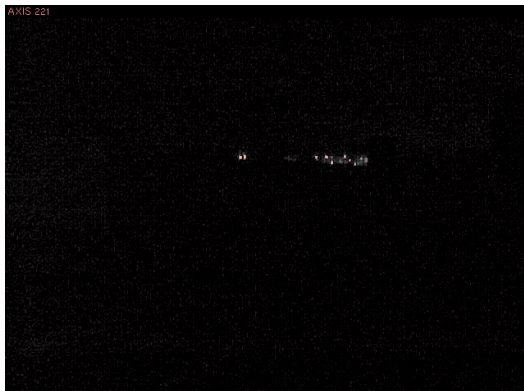
그림 2: 거리에 불빛이 없는 밤 시간(오후 10시 40분), 조명도가 약 0.1lux인 주변 지역의 감시 상황

서로 다른 종류의 세 가지 감시 카메라, 즉 AXIS 221과 Lightfinder 기술이 내장된 AXIS Q1602-E 카메라, 품질이 뛰어난 경쟁사의 저조도 아날로그 카메라를 야간에 다양한 시나리오로 비교해 보았다. 비교 결과, Lightfinder 기술이 탑재된 네트워크 카메라는 풀 프레임 레이트에서 노이즈는 더 적고 이미지 품질 수준은 보다 높은 영상을 제공했지만, 아날로그 카메라는 일부 조명 조건에서 컬러 이미지를 만들어내지 못했다.