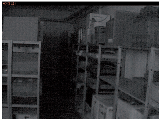
그림 4: 조명 조건이 열악한 상황에서의 창고 감시 상황

왼쪽: AXIS 221 왼쪽 아래: 품질이 뛰어난 저조도 아날로그 카메라 오른쪽 아래: Lightfinder 기술을 갖춘 AXIS Q1602